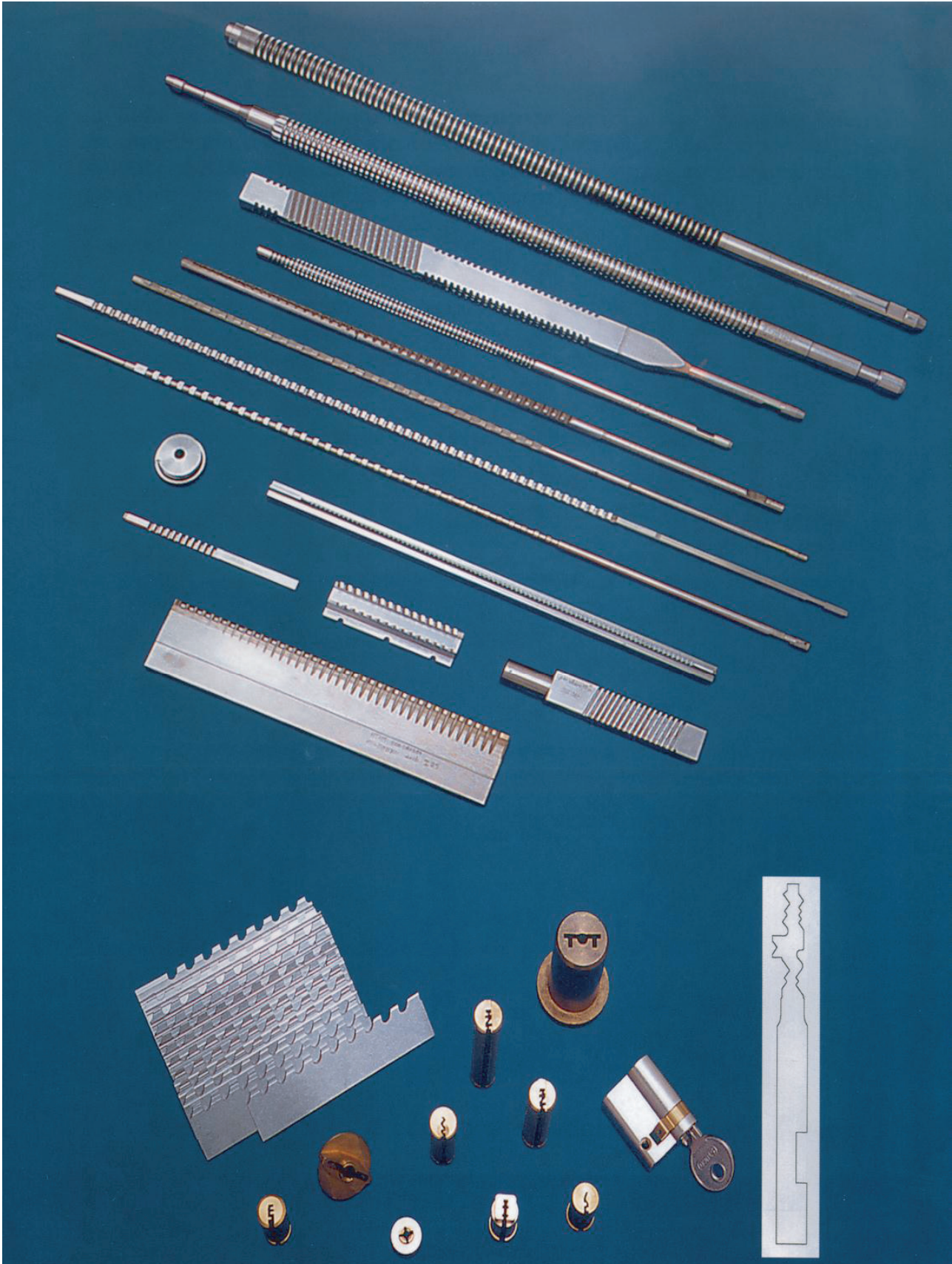
Siamo specialisti in brocche per cilindri per serrature